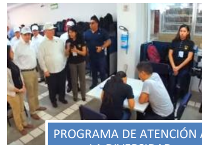
PROGRAMA DE ATENCIÓN A LA DIVERSIDAD