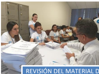
REVISIÓN DEL MATERIAL DE APLICACIÓN