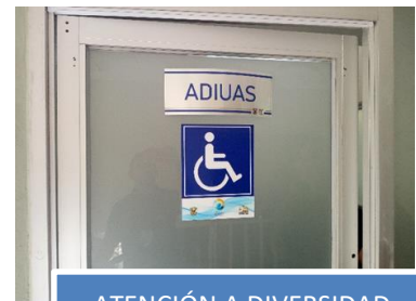
ATENCIÓN A DIVERSIDAD