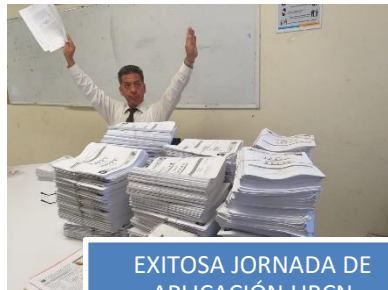
EXITOSA JORNADA DE APLICACIÓN URCN