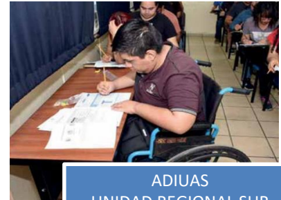
ADIUAS UNIDAD REGIONAL SUR