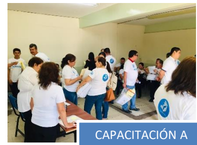
CAPACITACIÓN A MONITORES