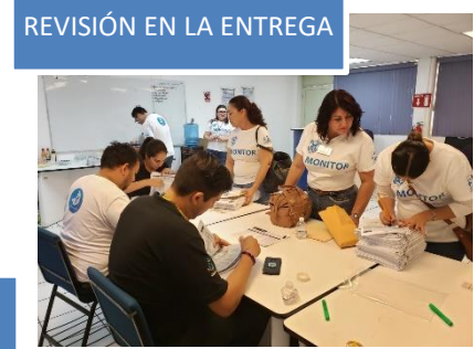
REVISIÓN EN LA ENTREGA