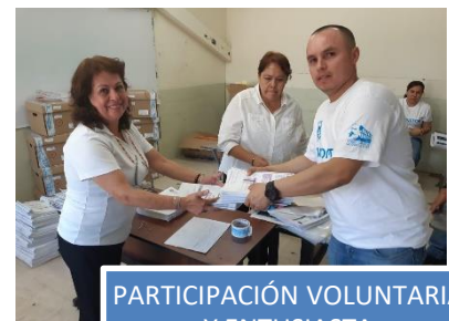
PARTICIPACIÓN VOLUNTARIA Y ENTUSIASTA