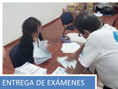
ENTREGA DE EXÁMENES APLICADOS