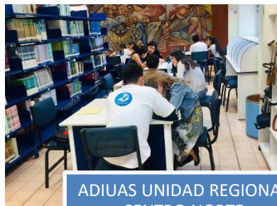
ADIUAS UNIDAD REGIONAL CENTRO NORTE