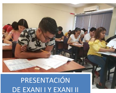
PRESENTACIÓN DE EXANI I Y EXANI II