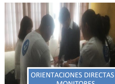
ORIENTACIONES DIRECTAS A MONITORES