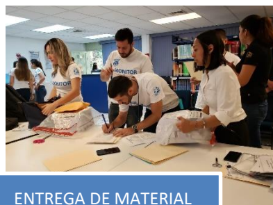
ENTREGA DE MATERIAL