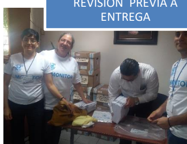
REVISIÓN PREVIA A ENTREGA