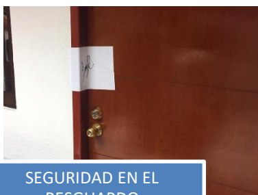
SEGURIDAD EN EL RESGUARDO