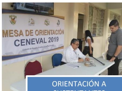
ORIENTACIÓN A SUSTENTANTES