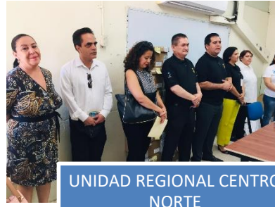
UNIDAD REGIONAL CENTRO NORTE