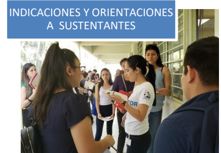
INDICACIONES Y ORIENTACIONES A SUSTENTANTES