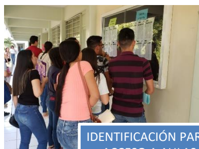
IDENTIFICACIÓN PARA ACCESO A AULAS