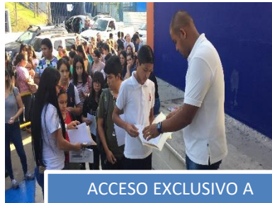
ACCESO EXCLUSIVO A ASPIRANTES