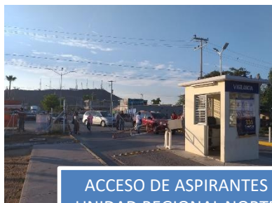
ACCESO DE ASPIRANTES UNIDAD REGIONAL NORTE