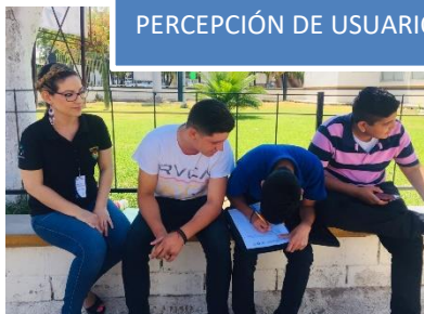
PERCEPCIÓN DE USUARIOS