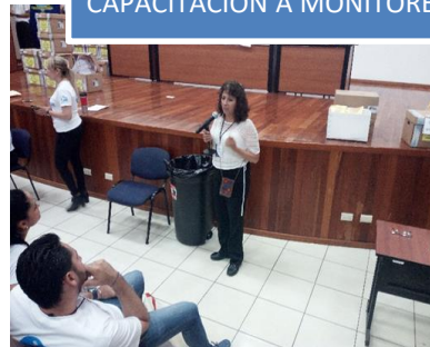
CAPACITACIÓN A MONITORES