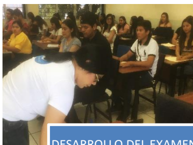
DESARROLLO DEL EXAMEN