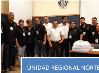
UNIDAD REGIONAL NORTE