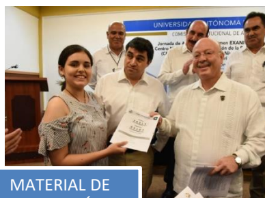
MATERIAL DE APLICACIÓN