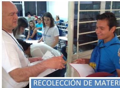
RECOLECCIÓN DE MATERIAL SOBRANTE