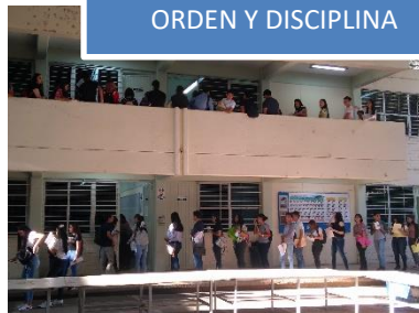
ORDEN Y DISCIPLINA