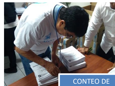
CONTEO DE CUADERNILLOS