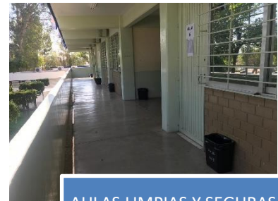
AULAS LIMPIAS Y SEGURAS