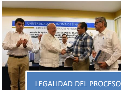
LEGALIDAD DEL PROCESO