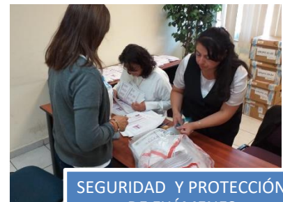
SEGURIDAD Y PROTECCIÓN DE EXÁMENES