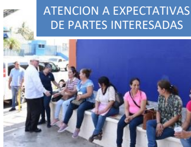
ATENCIÓN A EXPECTATIVAS DE PARTES INTERESADAS