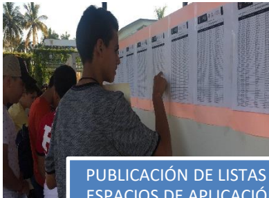
PUBLICACIÓN DE LISTAS Y ESPACIOS DE APLICACIÓN