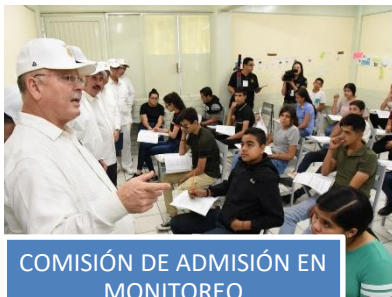
COMISIÓN DE ADMISIÓN EN MONITOREO