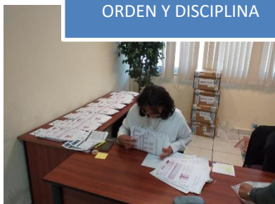
ORDEN Y DISCIPLINA