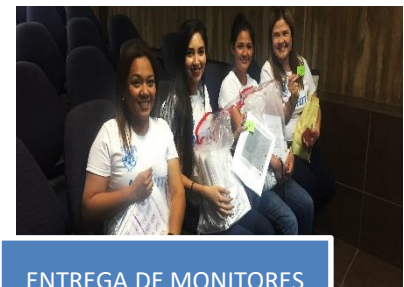
ENTREGA DE MONITORES