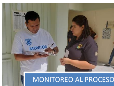
MONITOREO AL PROCESO EN SITIO