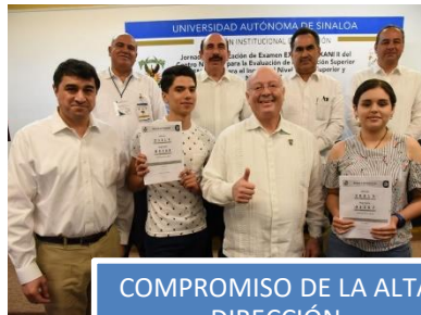
COMPROMISO DE LA ALTA DIRECCIÓN