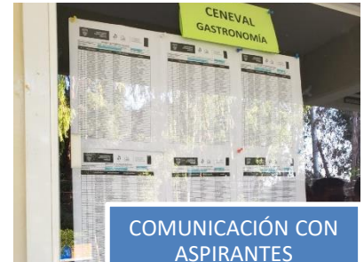
COMUNICACIÓN CON ASPIRANTES