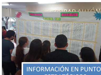
INFORMACIÓN EN PUNTOS ESTRATÉGICOS