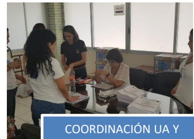
COORDINACIÓN UA Y CENEVAL