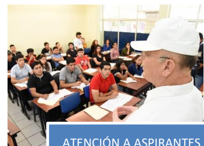
ATENCIÓN A ASPIRANTES