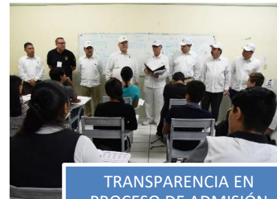
TRANSPARENCIA EN PROCESO DE ADMISIÓN