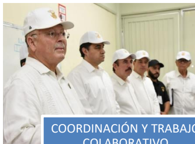
COORDINACIÓN Y TRABAJO COLABORATIVO