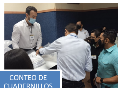
CONTEO DE CUADERNILLOS