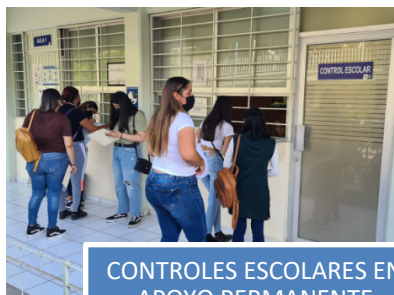
CONTROLES ESCOLARES EN APOYO PERMANENTE