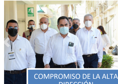
COMPROMISO DE LA ALTA DIRECCIÓN