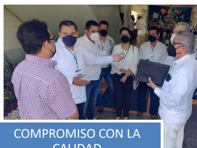
COMPROMISO CON LA CALIDAD