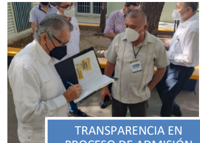
TRANSPARENCIA EN PROCESO DE ADMISIÓN