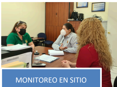
MONITOREO EN SITIO