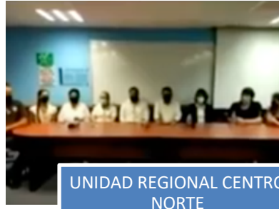
UNIDAD REGIONAL CENTRO NORTE