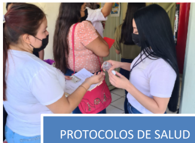
PROTOCOLOS DE SALUD