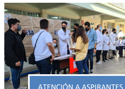
ATENCIÓN A ASPIRANTES