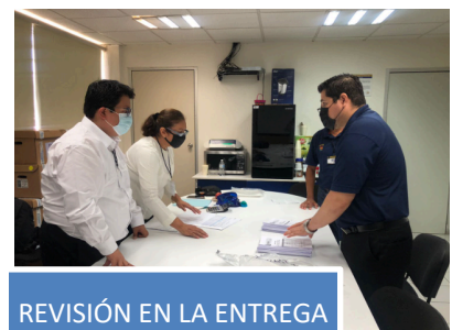
REVISIÓN EN LA ENTREGA