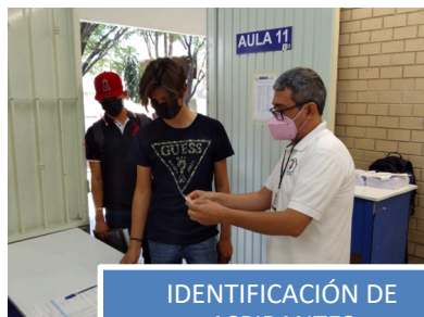
IDENTIFICACIÓN DE ASPIRANTES