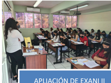
APLICACIÓN DE EXANI II