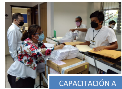
CAPACITACIÓN A MONITORES