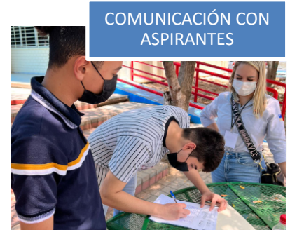
COMUNICACIÓN CON ASPIRANTES