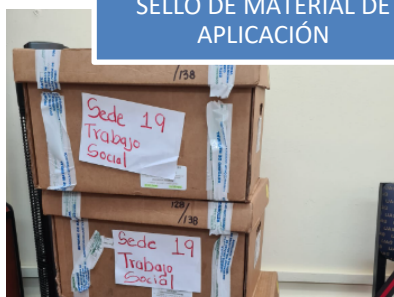
SELLO DE MATERIAL DE APLICACIÓN