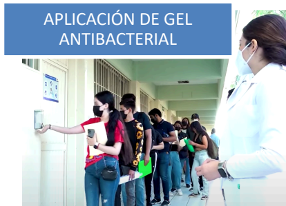
APLICACIÓN DE GEL ANTIBACTERIAL