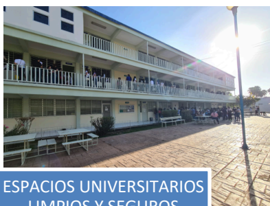
ESPACIOS UNIVERSITARIOS LIMPIOS Y SEGUROS