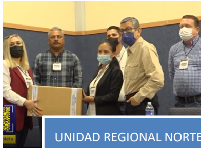
UNIDAD REGIONAL NORTE