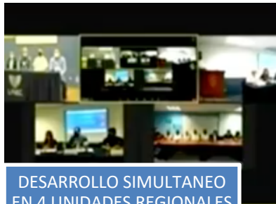
DESARROLLO SIMULTANEO EN 4 UNIDADES REGIONALES