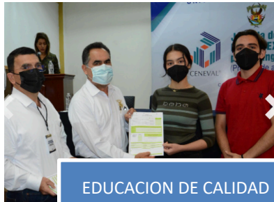
EDUCACION DE CALIDAD