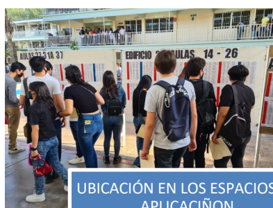
UBICACIÓN EN LOS ESPACIOS DE APLICACIÓN