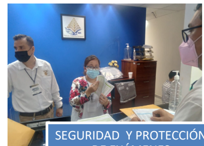
SEGURIDAD Y PROTECCIÓN DE EXÁMENES