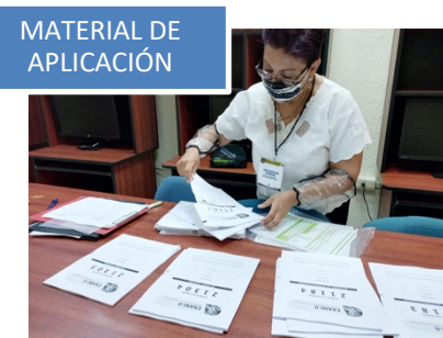
MATERIAL DE APLICACIÓN