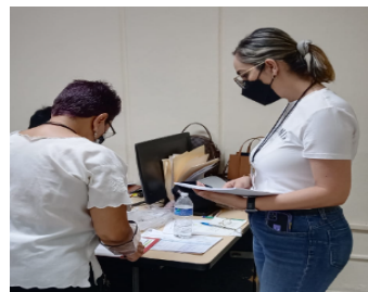
RECOLECCIÓN DE MATERIAL NO UTILIZADO