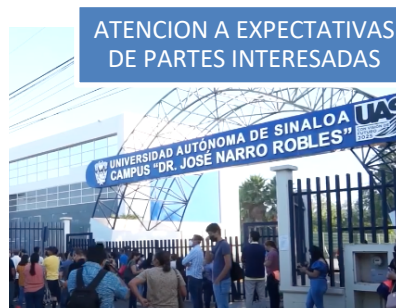
ATENCIÓN A EXPECTATIVAS DE PARTES INTERESADAS