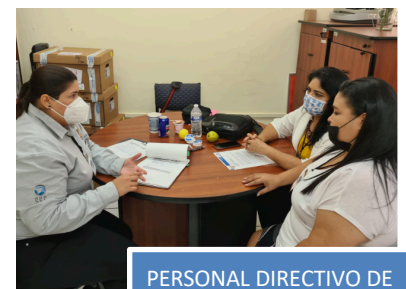
PERSONAL DIRECTIVO DE UA EN COORDINACIÓN