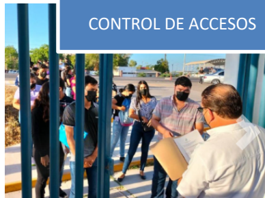
CONTROL DE ACCESOS