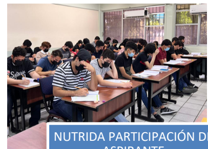
NUTRIDA PARTICIPACIÓN DE ASPIRANTE