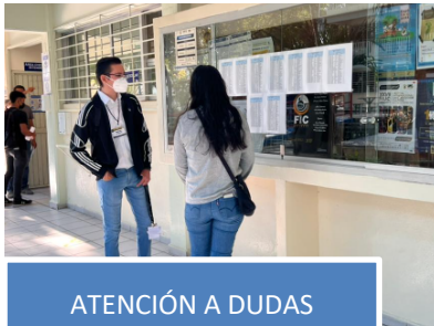
ATENCIÓN A DUDAS