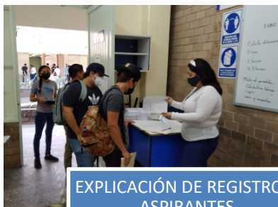
EXPLICACIÓN DE REGISTRO A ASPIRANTES