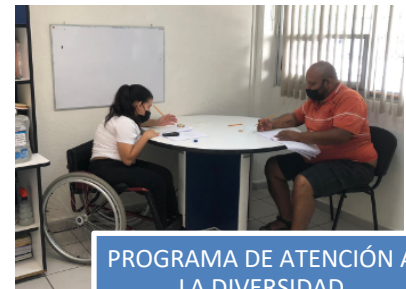
PROGRAMA DE ATENCIÓN A LA DIVERSIDAD