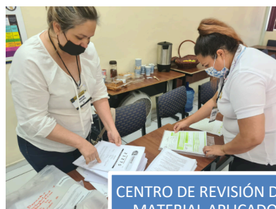
CENTRO DE REVISIÓN DEL MATERIAL APLICADO