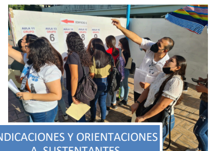
INDICACIONES Y ORIENTACIONES A SUSTENTANTES