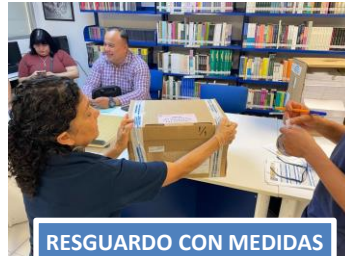
RESGUARDO CON MEDIDAS DE SEGURIDAD