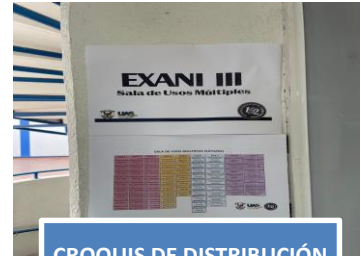
CROQUIS DE DISTRIBUCIÓN