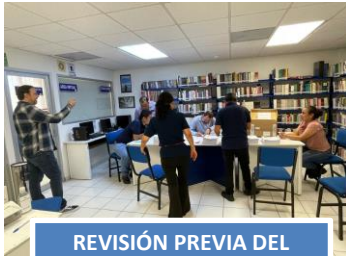
REVISIÓN PREVIA DEL MATERIAL