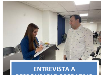
ENTREVISTA A RESPONSABLE OPERATIVO