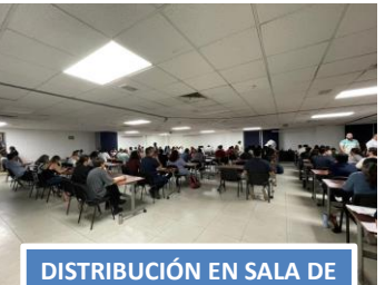
DISTRIBUCIÓN EN SALA DE USOS MÚLTIPLES