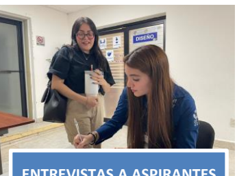
ENTREVISTAS A ASPIRANTES