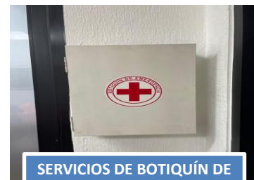
SERVICIOS DE BOTIQUÍN DE EMERGENCIA