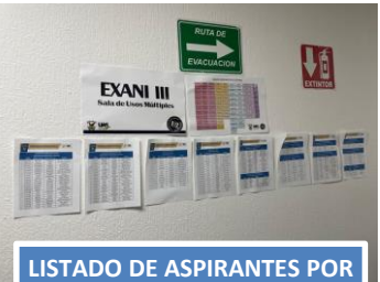
LISTADO DE ASPIRANTES POR PROGRAMA EDUCATIVO