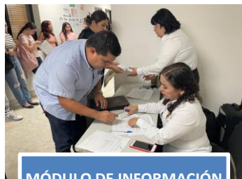
MÓDULO DE INFORMACIÓN