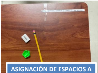
ASIGNACIÓN DE ESPACIOS A ASPIRANTES Y MATERIALES