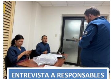
ENTREVISTA A RESPONSABLES DE CENEVAL