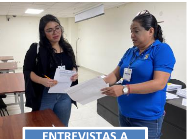
ENTREVISTAS A MONITORES