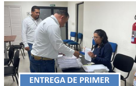
ENTREGA DE PRIMER GRUPO