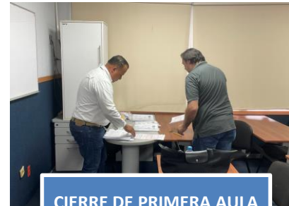
CIERRE DE PRIMERA AULA