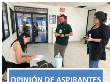
OPINIÓN DE ASPIRANTES