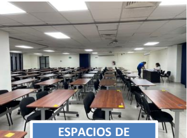
ESPACIOS DE APLICACIÓN