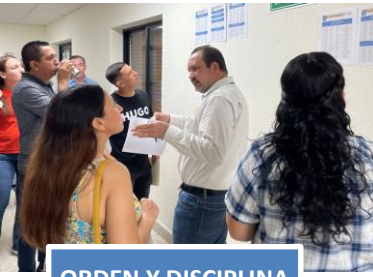
ORDEN Y DISCIPLINA