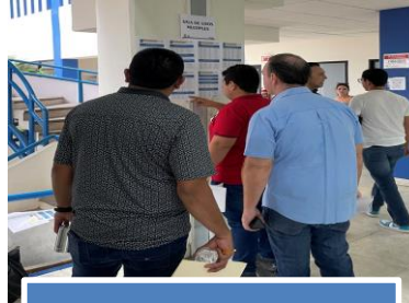
LLEGADA DE ASPIRANTES