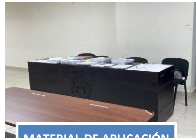
MATERIAL DE APLICACIÓN