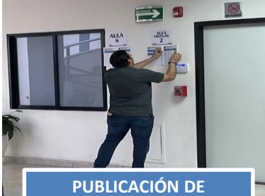
PUBLICACIÓN DE DISTRIBUCIÓN DE AULAS